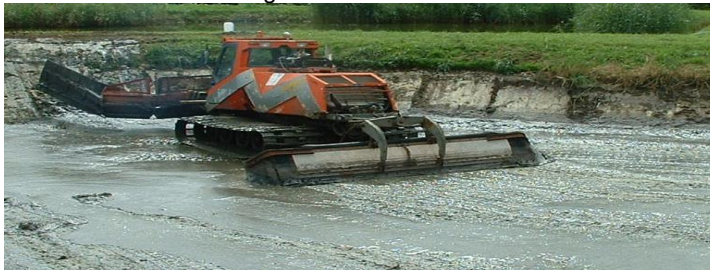
Curage proprement dit