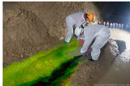
Injection de colorant à la grotte de Préoux

Deux points d'injection de colorant : la grotte de Préoux à Ruffieu et les pertes aux Plans d'Hotonnes