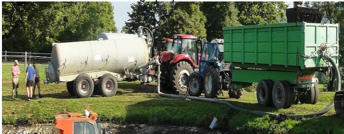
Transport des boues