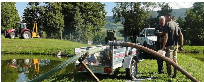
Vidange du bassin 1 vers le 2.